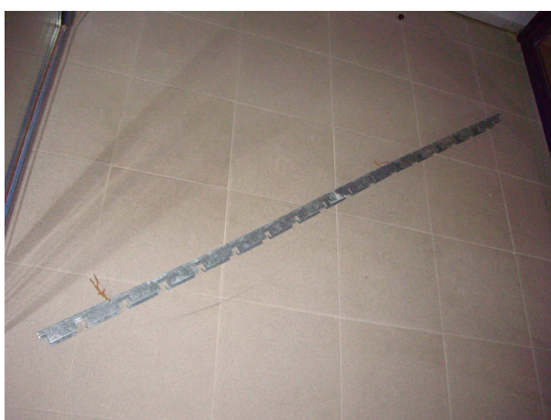
foto 14. aquest perfil metàl·lic galvanitzat tenia la funció de fixar les plaques caigudes. El perfil estava suspès del sostre amb filferros.