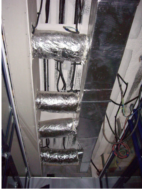
foto 5. detall dels panells que falten al porxo exterior. s'aprecia que estaven subjectes a una estructura metàl·lica fixe. Els panells van caure fa dies per causes del vent.