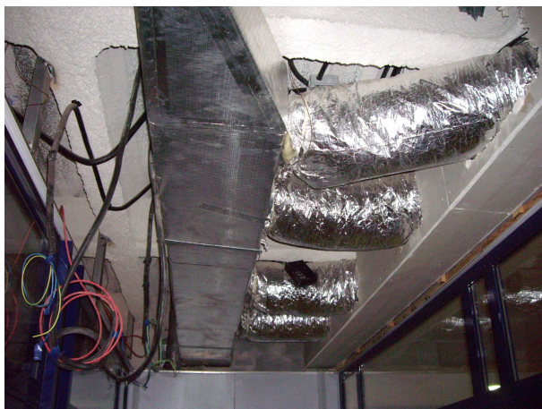
foto 10. detall de la part després recentment on es pot observar que NO EXISTEIX cap estructura fixe per subjectar les plaques.