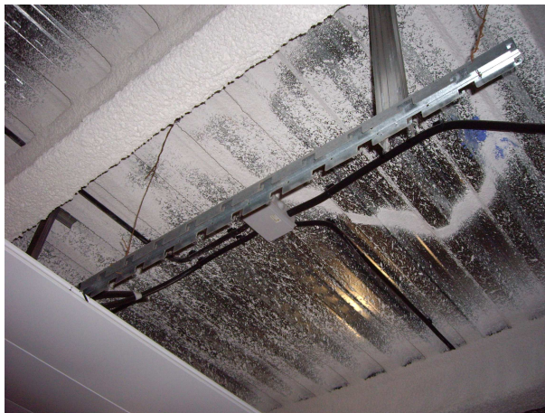
foto 9. estructura de fixació de les plaques caigudes fa dies del porxo exterior.