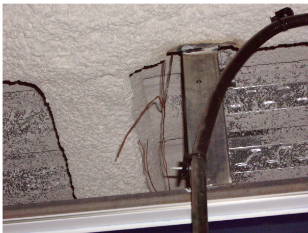
foto 13. i un altre filferro.