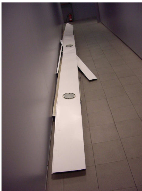
foto 2. panells d'alumini retirats. Son de 8 metres de llarg i pesen uns 5 quilograms cadascú.