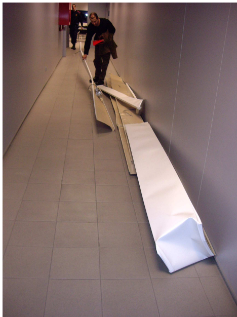
foto 1. panells d'alumini retirats. Total 5 panells