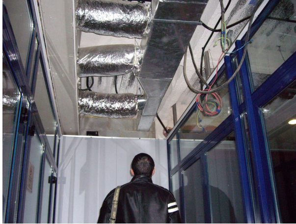
foto 7. detall de l'alçada. Son 3,5 metres.