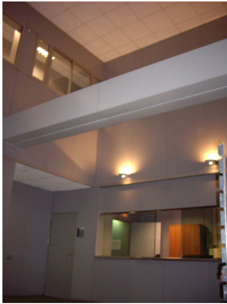
foto 16. l'actuació de l'aire no ha finalitzat encara. aquesta es l'alçada del vestíbul de l'ABP hi ha una alçada de 6 metres. La falta de plaques al sostre faciliten que l'aire entri pels fals sostres fins aquesta alçada. Les plaques de guix s'han desplaçat amb la possibilitat de caure des de aquesta alçada.