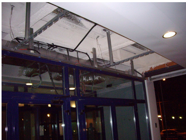
foto 3. porxo exterior l'entrada a l'ABP. Falten panells de dies anteriors que van caure.