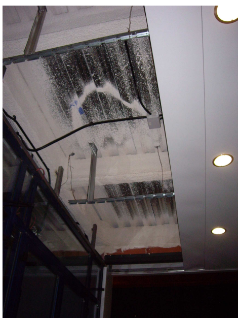
foto 4. porxo exterior l'entrada a l'ABP. Detall dels panells que falten de dies anteriors.