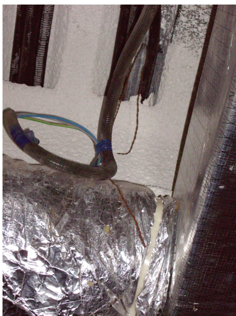
foto 12. s'observa un altre filferro que subjectava les plaques caigudes.