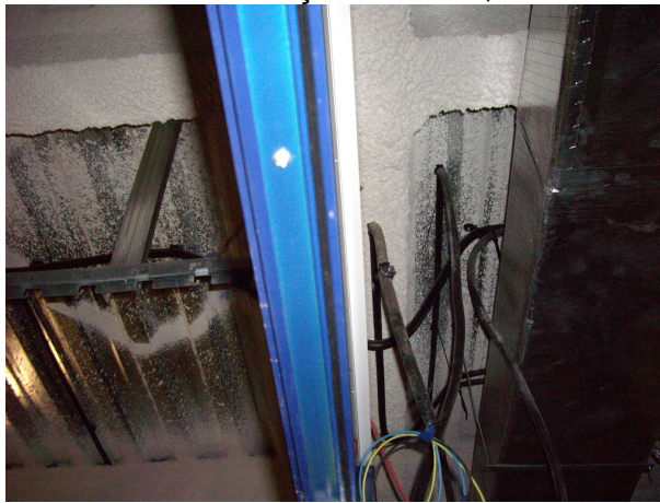
foto 8. detall IMPORTANT. Les plaques interiors que recents han caigut no disposen d'estructura de fixació (part dreta). Les de l'exterior (a l'esquerra) si que tenen una estructura metàl·lica de fixació amb perfils de ferro galvanitzat.