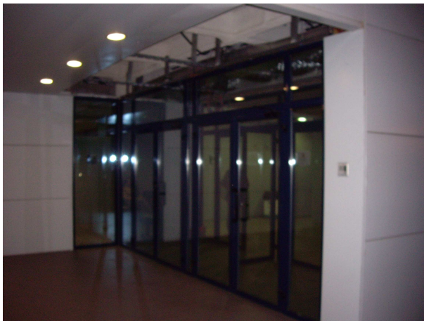
foto 6. L'estructura que ha caigut recentment. Son peces metàl·liques de 6 metres de longitud. La força del vent entrant des de l'exterior a través del forat deixa't per les plaques caigudes amb anterioritat han fet caure sostre.