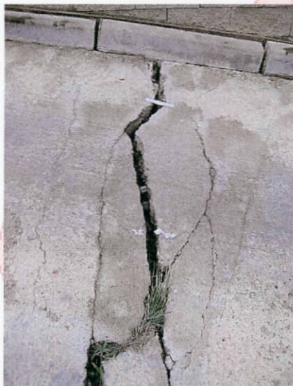
Testimonis 1 i 2