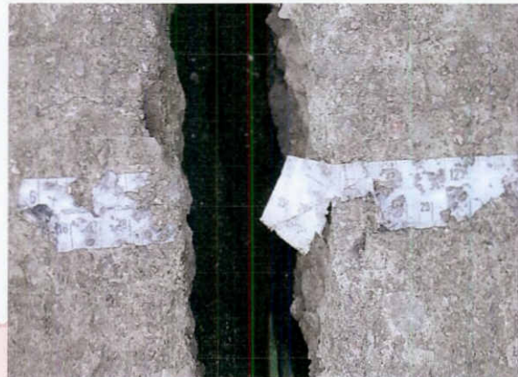
Testimoni 2 trencat