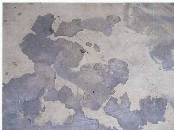
Paviment pàrquing -2