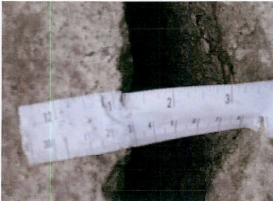
Testimoni 1 trencat

Per sort de tots no hem de lamentar danys personals però aquest fet tant greu és motiu suficient per exigir a la Subdirecció actuacions urgents respecte aquest tema.