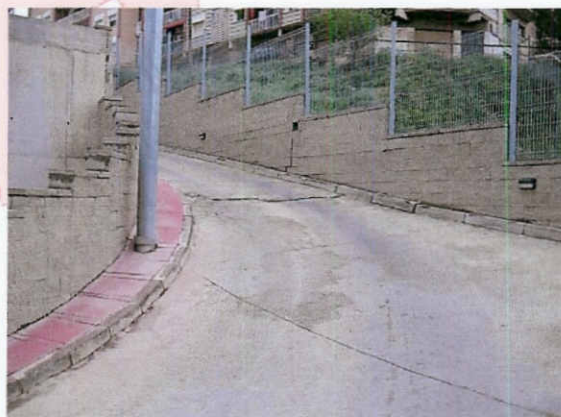
Paviment revolt rampa