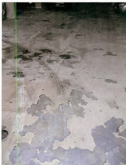
Paviment pàrquing -2

Sol·licitem reparar el paviment per tal d'evitar el lliscament dels vehicles.