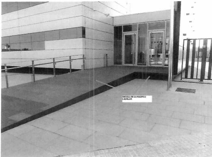
Foto 2. Entrada principal a la CD Mora d'Ebre amb la rampa i desnivells existents