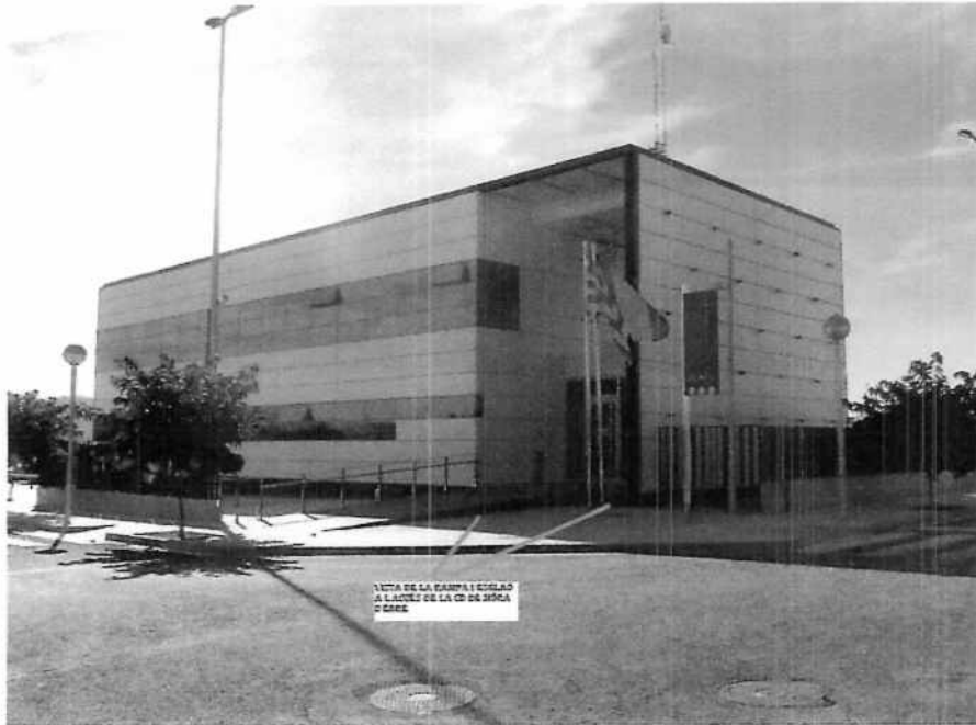
Foto 1. Façana principal de la CD Mora d'Ebre