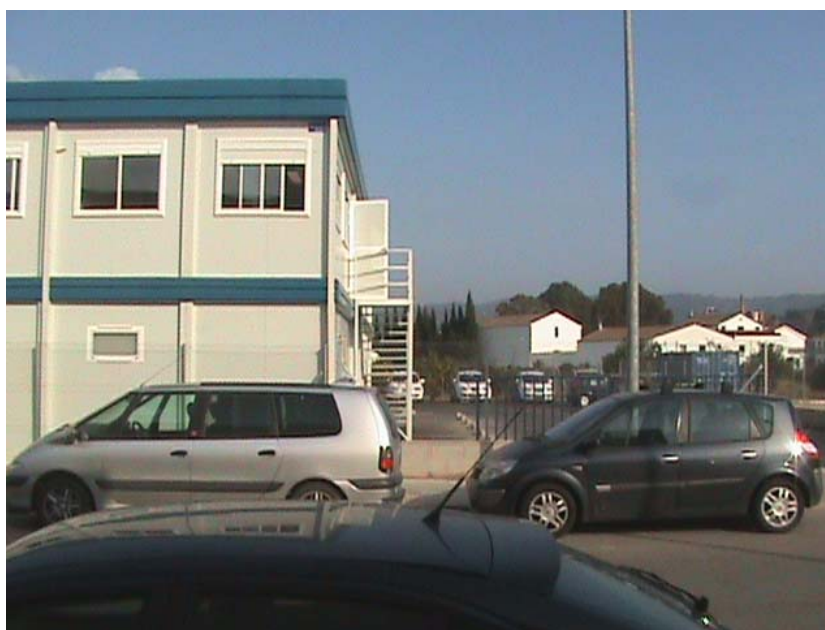
Mòduls provisionals a Tortosa