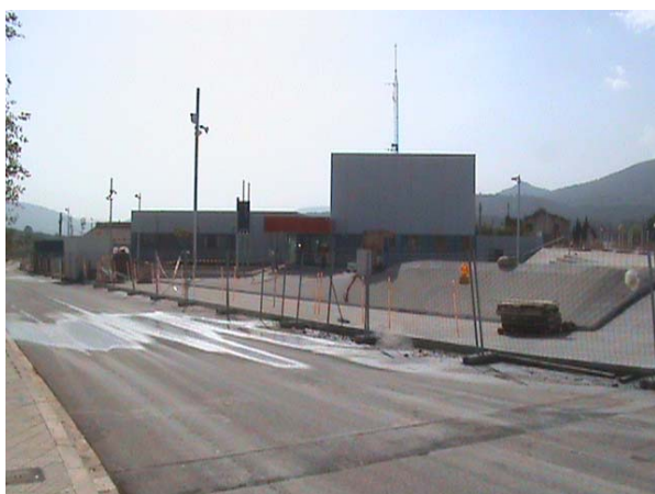
Imatge comissaria Montblanc, octubre 2008

TRANSIT A LA COMARCA DEL PRIORAT , es cobrirà amb nivell 1 i si és necessària la presència d'agents especialitzats en trànsit, anirà la patrulla més propera tant si és de RP Camp de Tgna, com de Terres de l'Ebre.