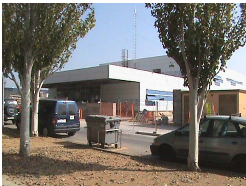
Futura comissaria de Valls.

em diu que no tindran armilles antitret !!), ... el que no hauria de ser és que el conseller es pengi les medalles.