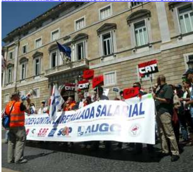
Concentració dels cossos policials davant la Generalitat.

HTTP://WWW.ELPUNT.CAT/NOTICIA/ARTICLE/24-PUNTDIVERS/4-DIVERS/177436.HTML