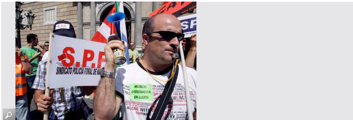
Desenes de policies es manifesten avui a la plaça Sant Jaume per la retallada salarial.

Mig centenar de policies d'almenys sis cossos policials diferents s'han manifestat aquest migdia davant el Palau de la Generalitat en protesta per la retallada salarial als funcionaris decidida pel Govern i en demanda d'una sèrie de mesures compensatòries a aquesta retallada. En la manifestació hi han participat els sindicats de Mossos d'Esquadra (Sindicat de Polícies de Catalunya i CAT), de l'Ertzaintza (Erne), de la Policia Foral Navarra (Sindicat de la Policia Foral), del Cos Nacional de Policia (SUP) i de les policies locals (Coordinadora de Polícies Locals). També hi ha participat l'Agrupació Unificada de Guàrdies Civils, una entitat no sindical ja que aquest cos té prohibit tenir sindicats.