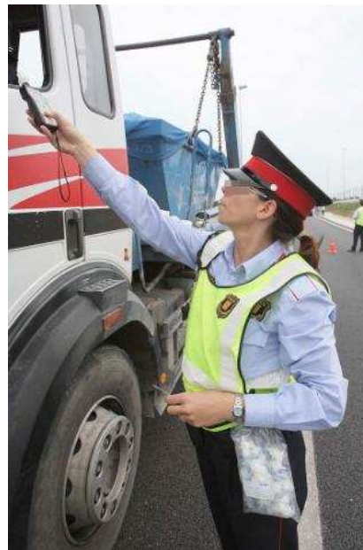
Una agent realitza un control d'alcoholèmia a Girona. diari de girona

A partir de novembre doncs, arrenca una nova etapa per a la policia autonòmica. Un període marcat per les incerteses. El mes de juliol sembla ser el punt d'arribada. Els 1.200 nous agents podran equiparar tots els territoris en funció de les seves necessitats. A més hi ha previstes, posteriorment, dues fornades més de 600 nous agents.