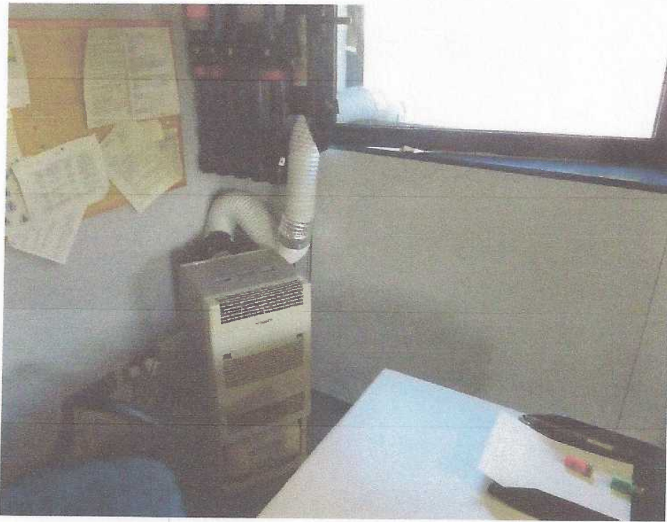
Dependències d'Administració/Suport de la CD Tàrraga.