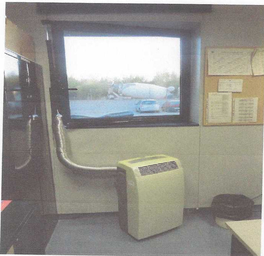
Dependències del Sector de Trànsit de Tàrraga.