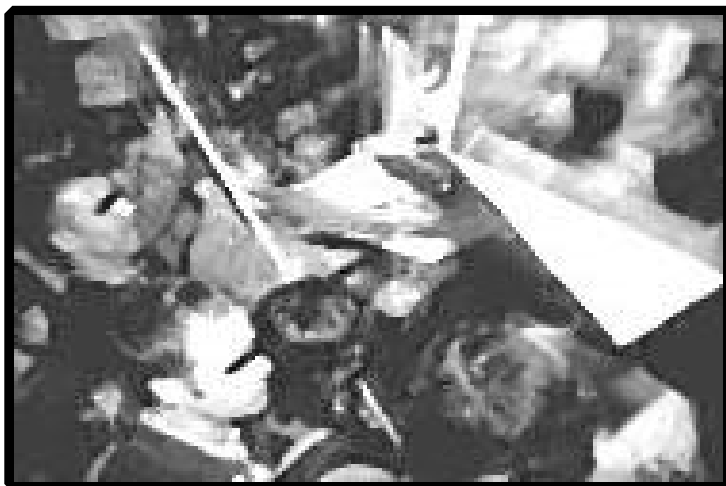
Aquests si que donen la cara

Com podeu comprovar els sindicats negociaran temes de "vital importància" pel futur dels mossos, cosa que des de MOFATANIG ens fa sospitar que potser alguna cosa fa molta pudor i no precisament a roses, sinó a pòdrit.