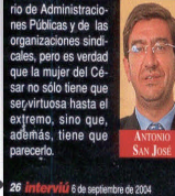
26 | interviú | 6 de septiembre de 2004

Algunos pueden pensar con todo derecho que podríamos encontrarnos ante una vía de ayuda económica a los sindicatos que dejaría en tela de juicio su independencia en decisiones futuras que afecten al Gobierno o que conlleven con medidas que éste adopte. Nadie duda de la realidad de la operación ni de la intachable y acrisolada honradez del Ministerio de Administraciones Públicas y de las organizaciones sindicales, pero es verdad que la mujer del César no sólo tiene que ser virtuosa hasta al extremo, sino que, además, tiene que parecerlo.