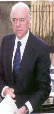
como empresarios que cumplen con la máxima de la acumulación de capital.

forma: 70 por ciento BBVA, 15 por ciento CCOO y 15 por ciento UGT. Ambos sindicatos son también accionistas de Fintid, otra gestora que quedó finalista. Gestión de Previsión y Pensiones es una empresa que genera importantes ganancias anuales. De acuerdo con las últimas cuentas presentadas en el Registro Mercantil de Madrid, en 2002 obtuvo unos beneficios de 1,3 millones de euros. El 70 por ciento de esta cantidad se destinó a reparto de dividendos. O sea que, al menos en este caso, Comisiones y UGT actúan