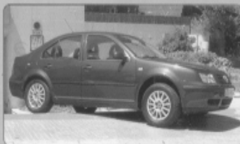
VOLKSWAGEN BORA 1.6 (105 cv), año 9/2001, concept-line, 4 puertas, 10.000 Km, 15950 Euros