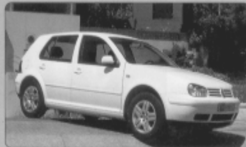
VOLKSWAGEN GOLF 1.6 Highline, (105 cv), año 12/2001, 5 puertas, módulo técnico, climatizador, 3.000 Km, 16750 Euros