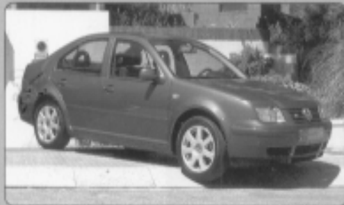
VOLKSWAGEN BORA V6 (204 cv), año 2001, 4 Motion, piel, full equipo, 5.000 Km, 25250 Euros