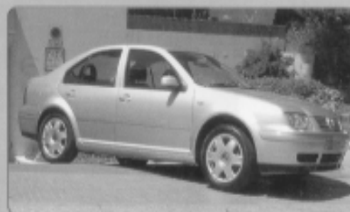
VOLKSWAGEN BORA 1.9 TDI (130 cv), año 2001, 4 motion, piel, clima, xenon, equipo c.disc, 4 puertas, 10.000 Km, 24950 Euros