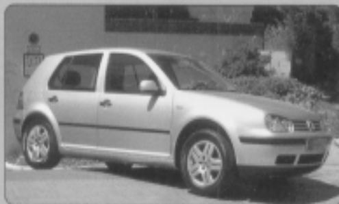
VOLKSWAGEN GOLF 1.9 TDI (90 cv), año 10/2001, concept-line, 5 puertas, 8.000 Km, 17130 Euros