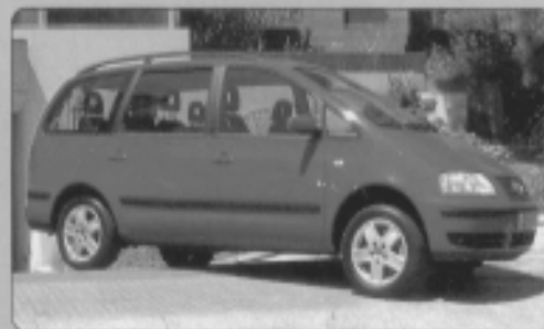
VOLKSWAGEN SHARAN 1.8 T (150 cv), año 2001, confort-line, 5 puertas, 7.500 Km, 25250 Euros