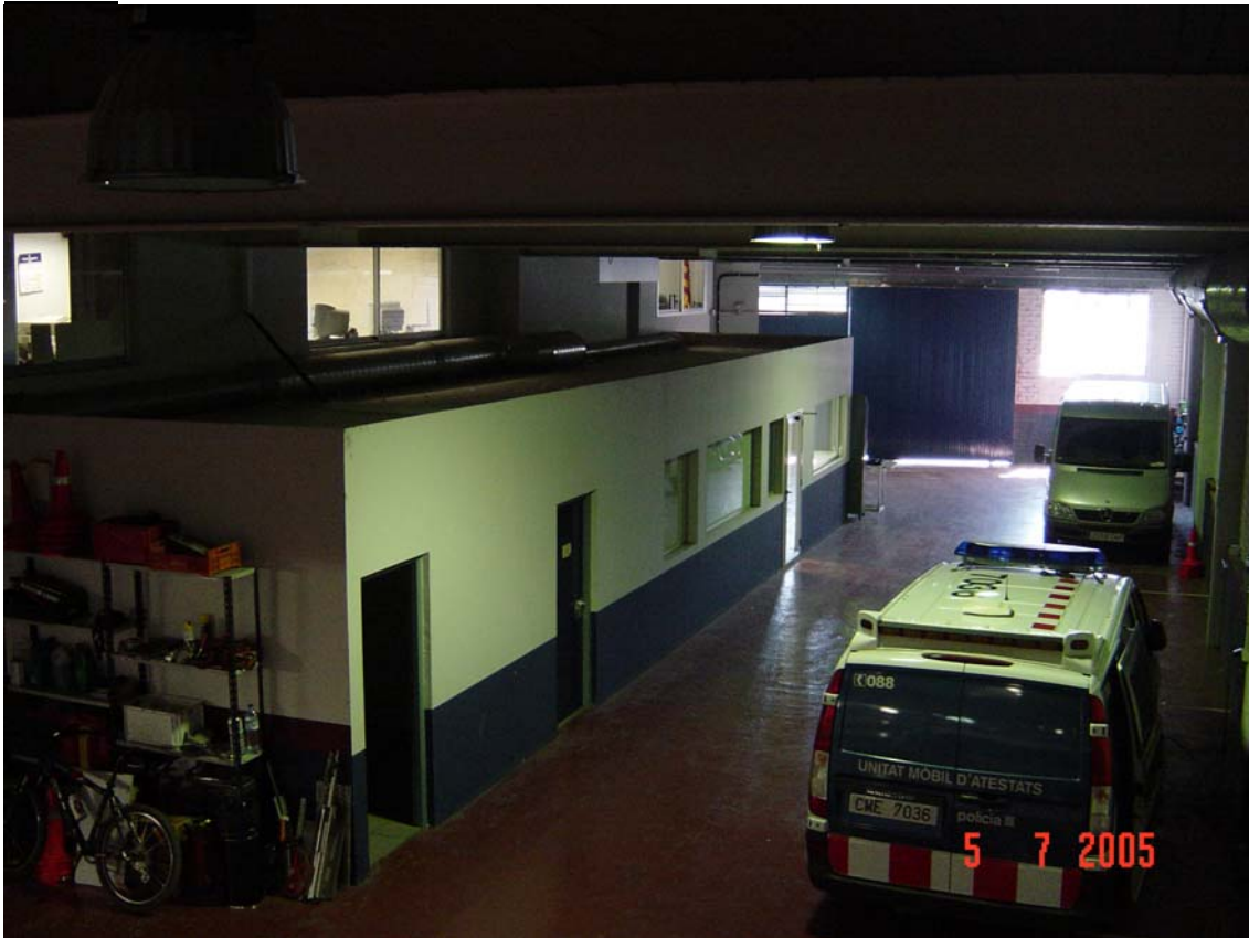
Dependències sense llum natural ni ventilació a l'exterior i amb barreres arquitectòniques