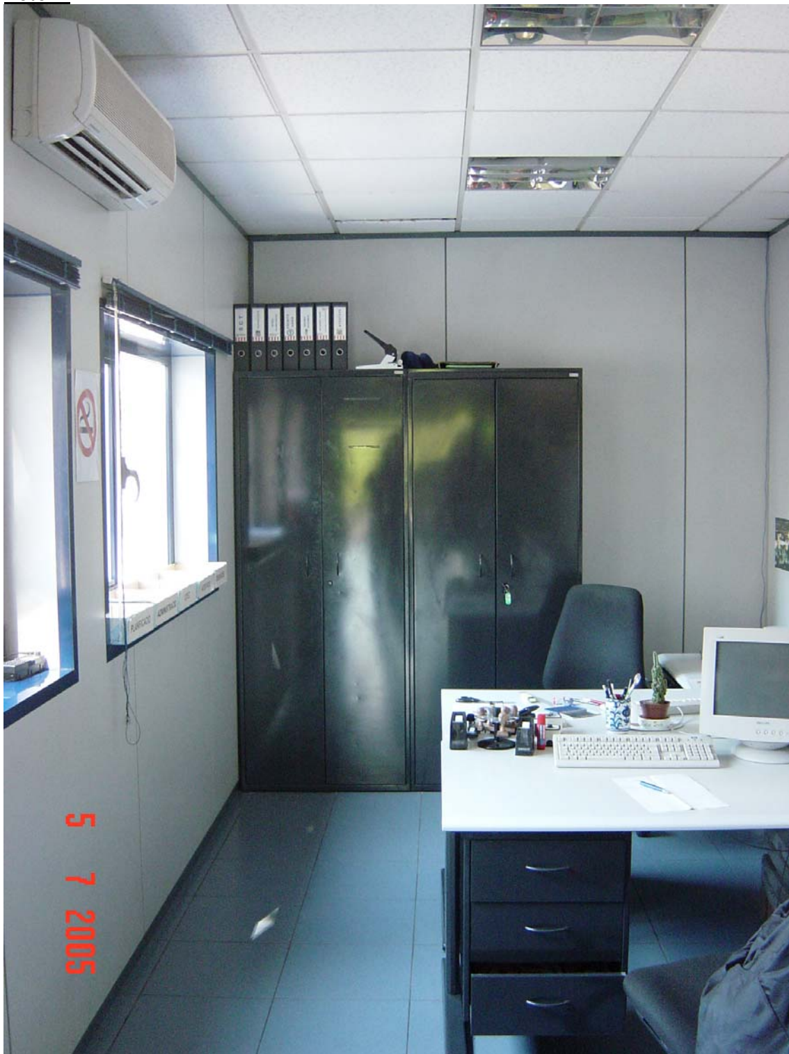
La ubicació de l'aire condicionat és perjudicial per als agents