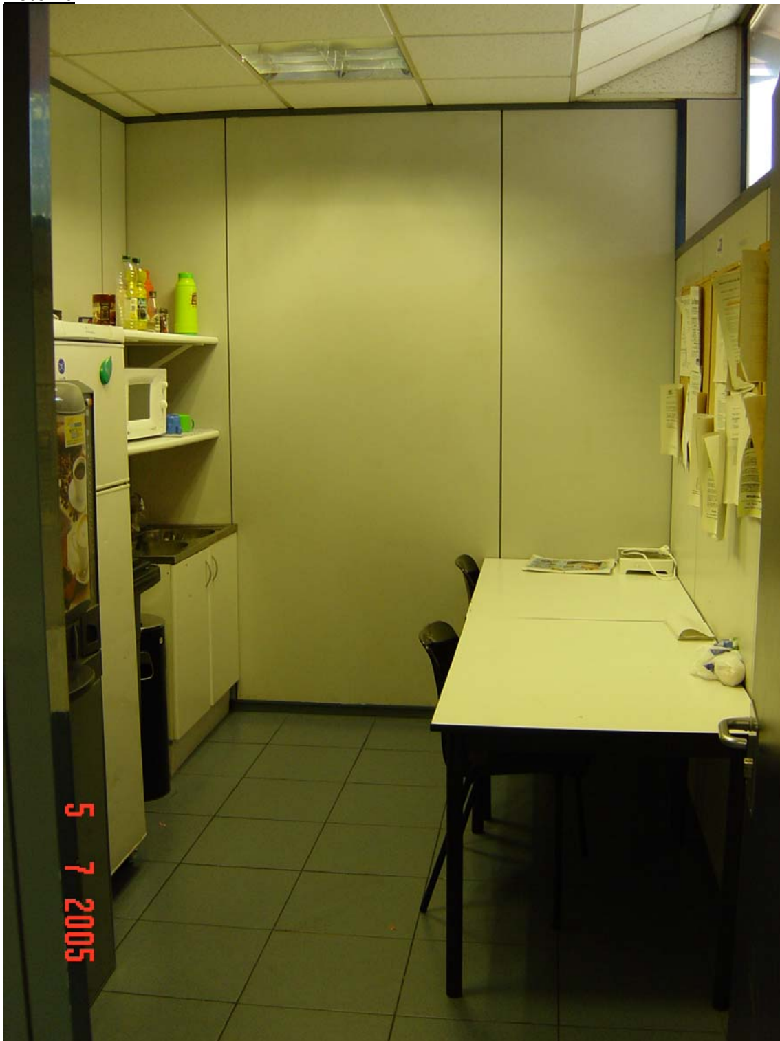
Menjador molt petit i sense cap tipus de ventilació