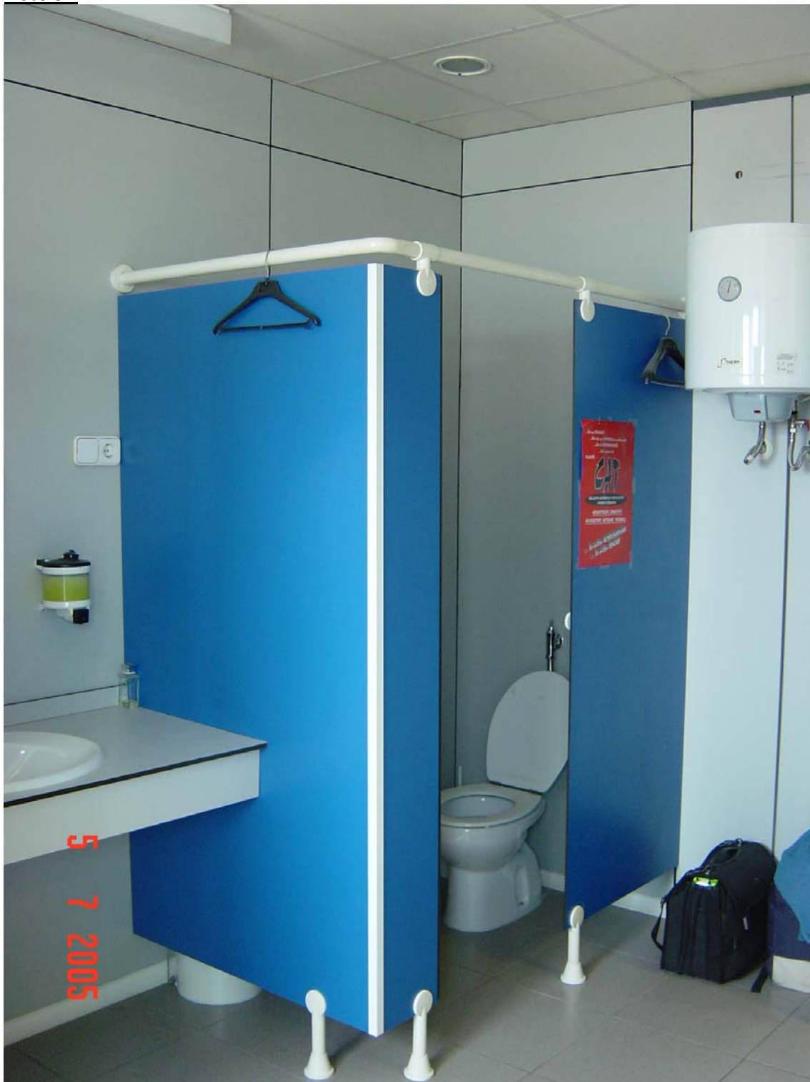
Lavabo de dones sense ventilació