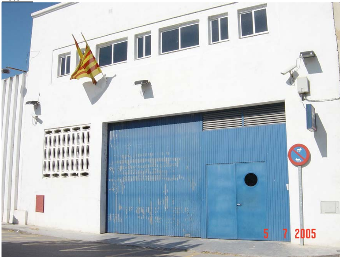
Entrada principal de comissaria inadequada