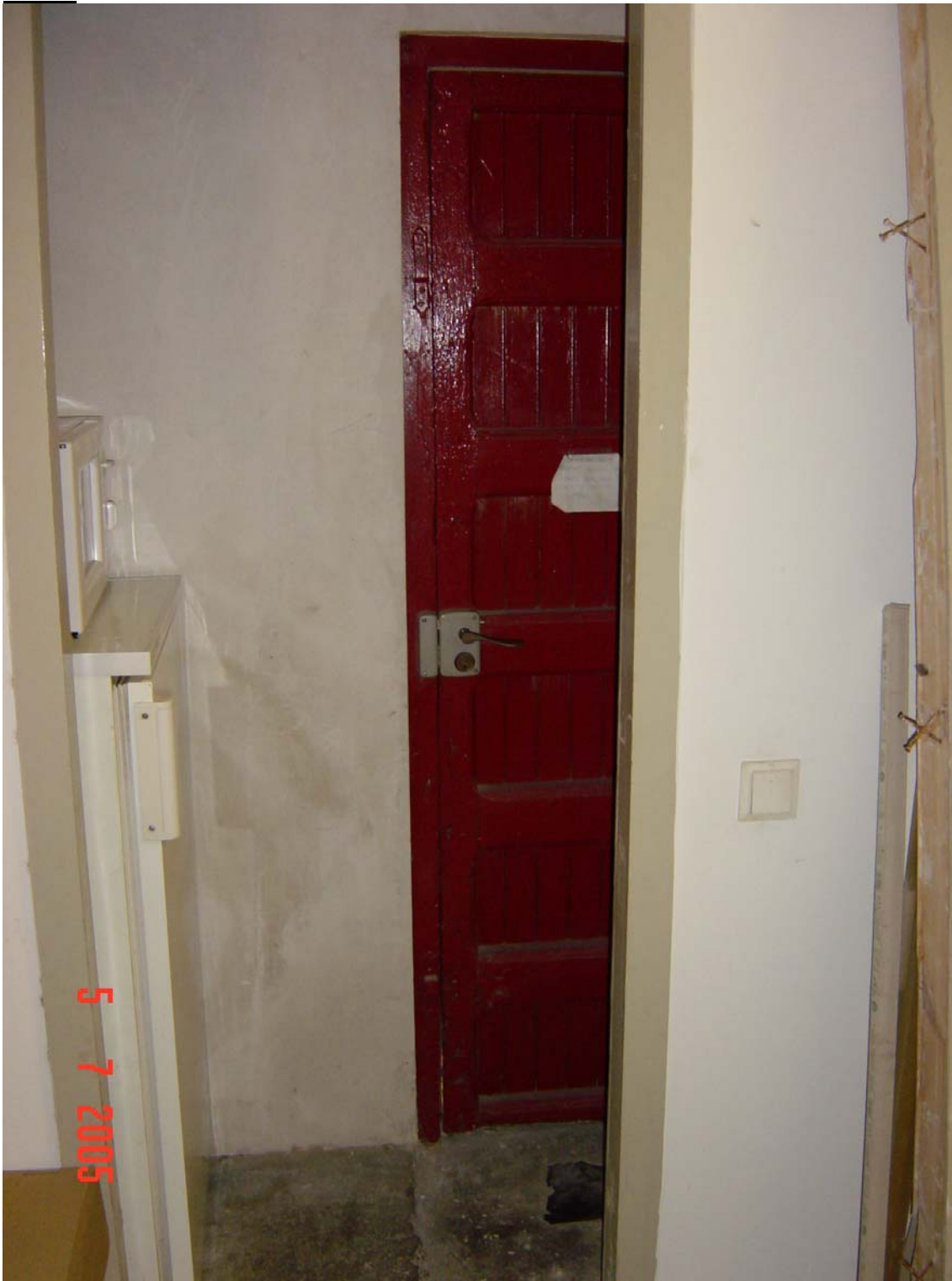
Porta sense cap seguretat tenint en compte que es comparteix amb vivendes particulars