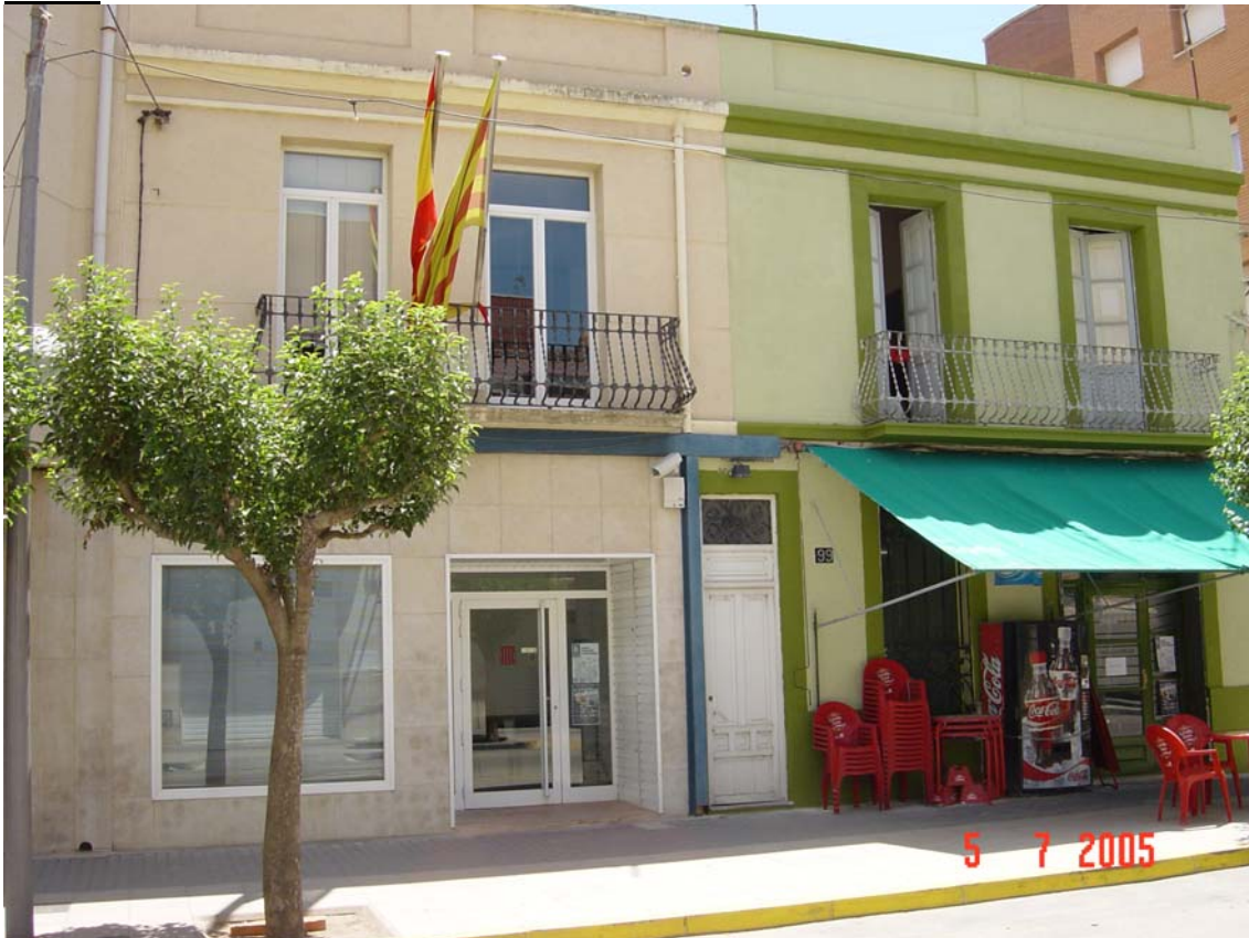
Accessos no adequats