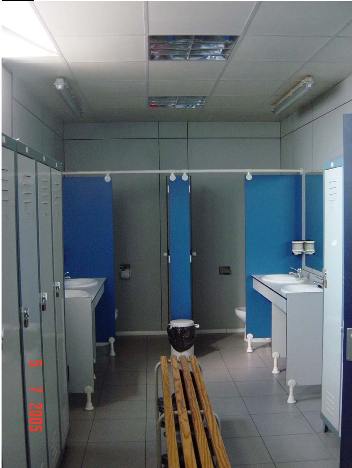
Ubicació inadequada dels lavabos