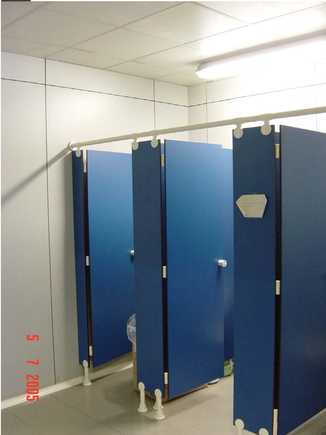
Lavabos sense ventilació