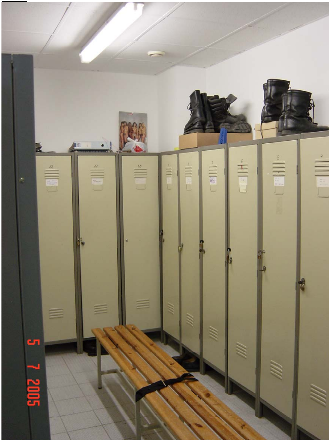
Vestuari d'homes petit i sense ventilació