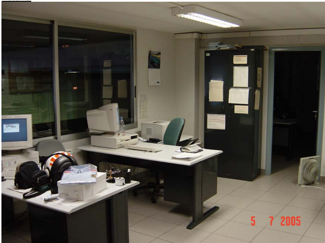
Dependències sense llum natural ni ventilació a l'exterior