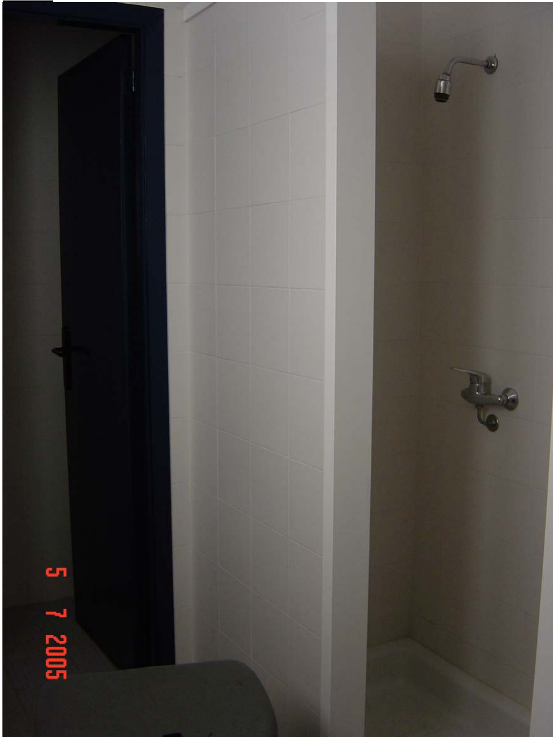
Vestuari de dones sense ventilació