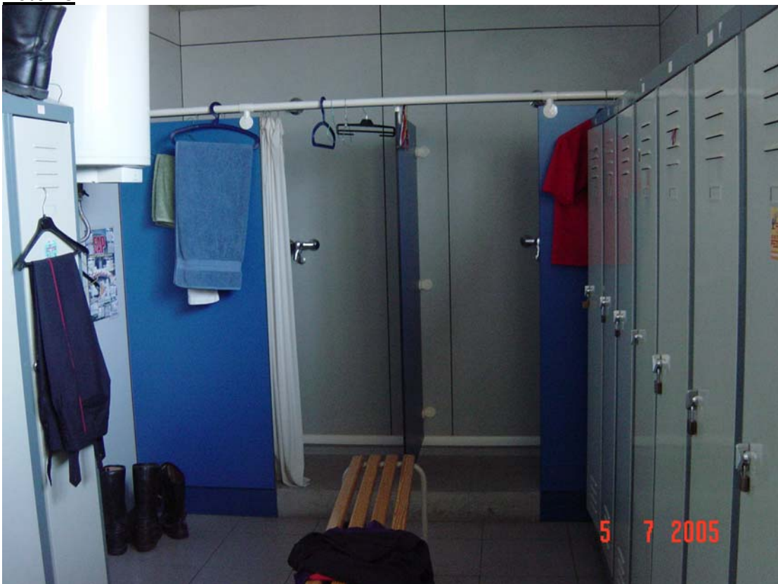
Mala ubicació de les dutxes