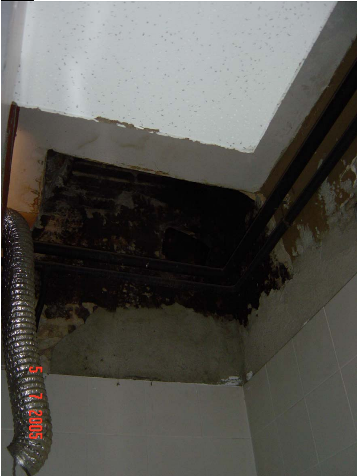
Deficiències greus en el sostre del lavabo dels vestidors d'homes