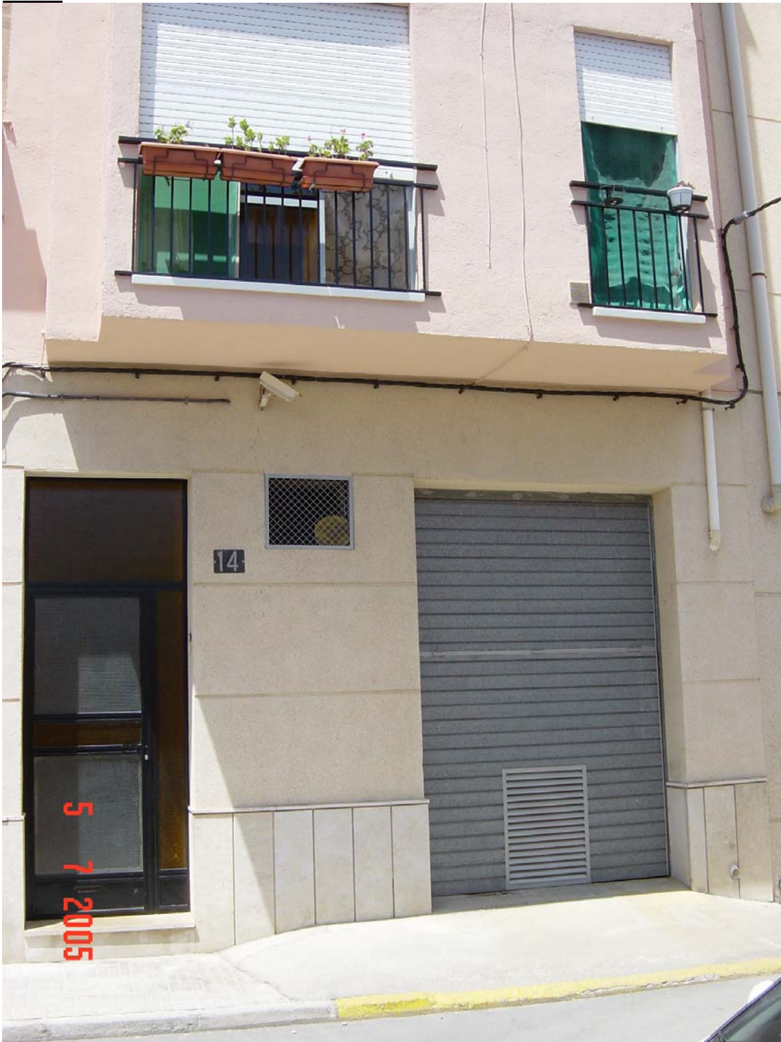
Accessos a la comissaria no adequats i manca de seguretat