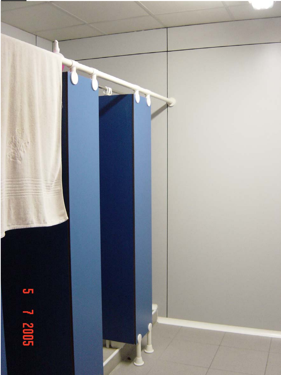
Dutxes sense ventilació