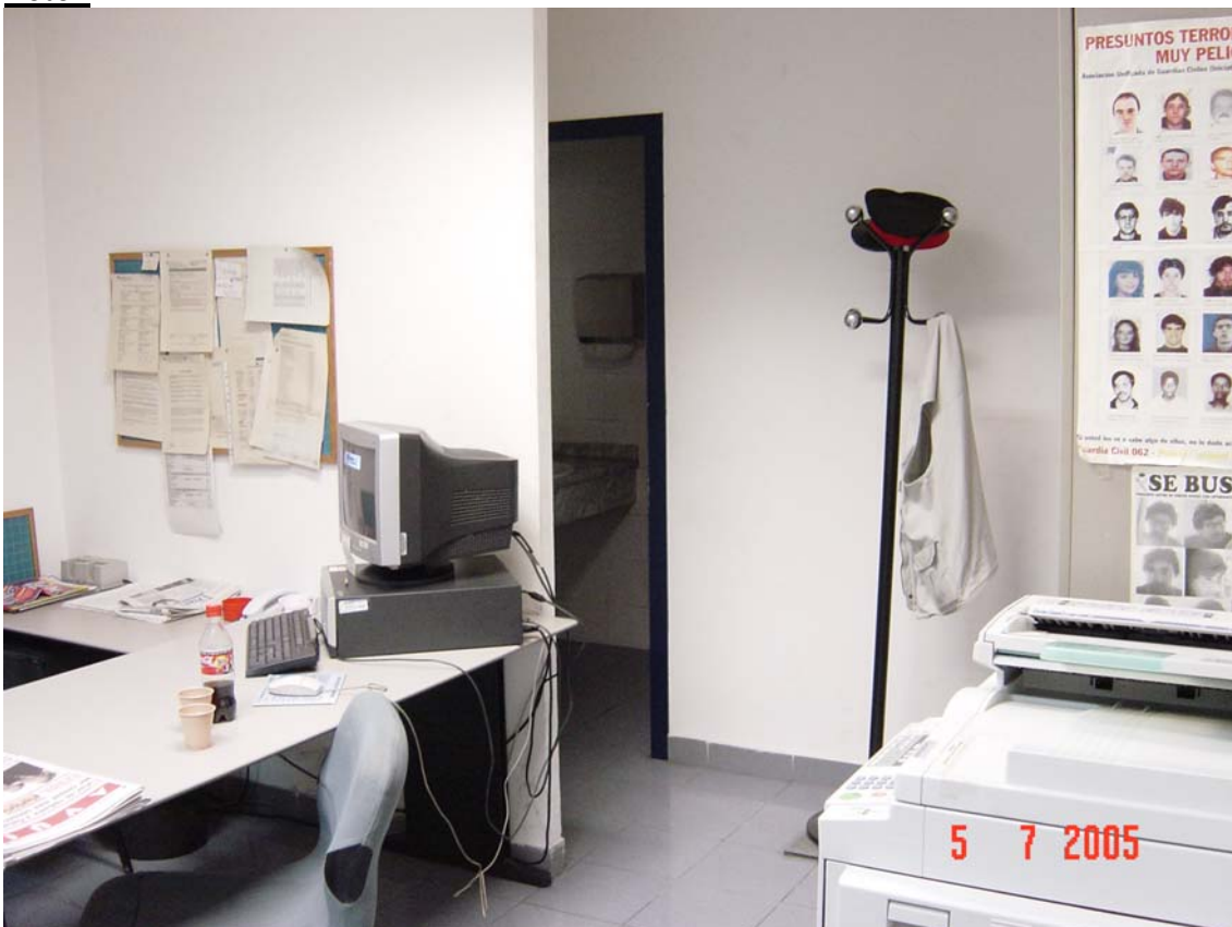
Dependències sense ventilació i amb barreres arquitectòniques