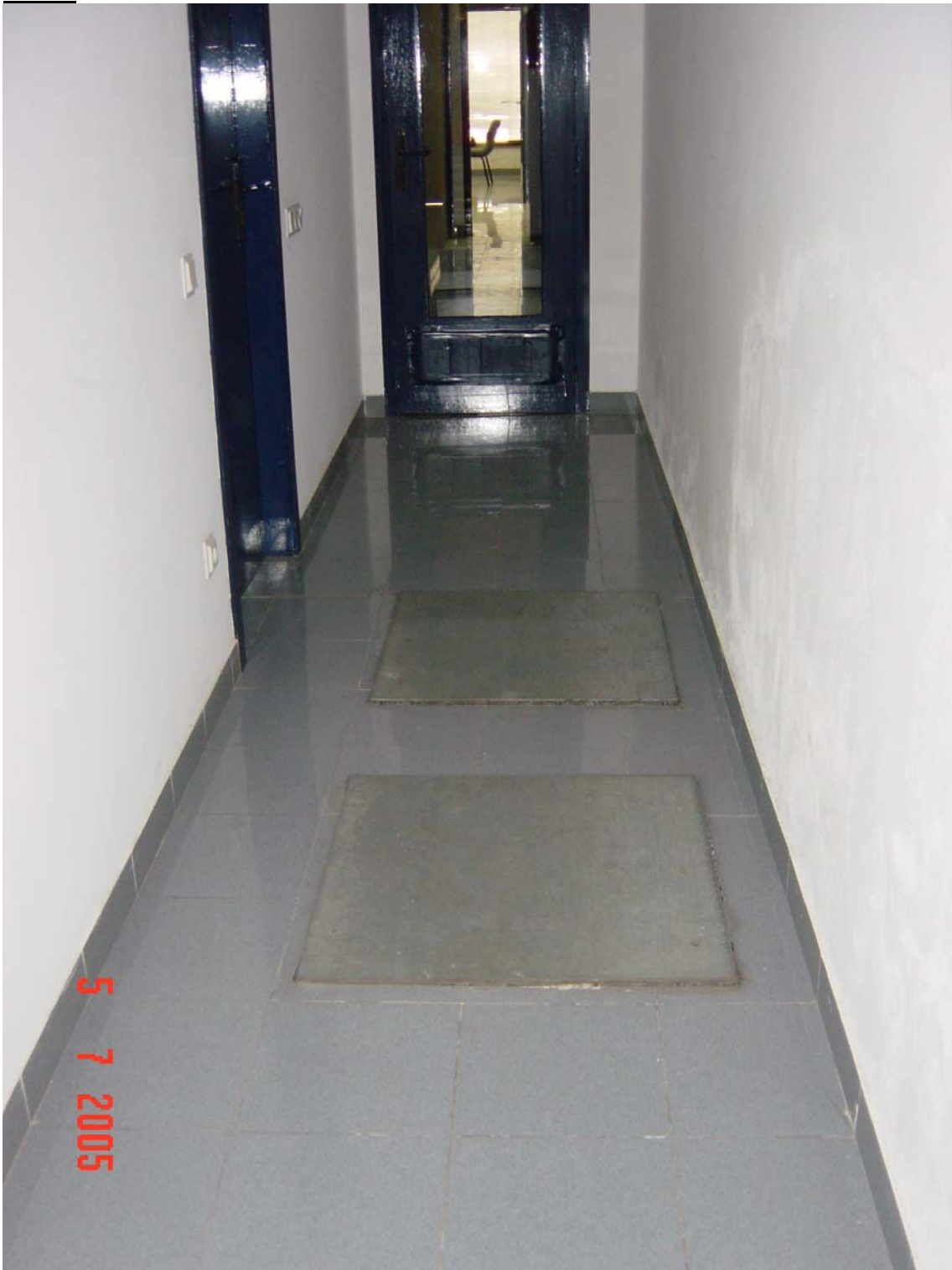
Tapes de clavegueram que no compleixen la normativa sanitària