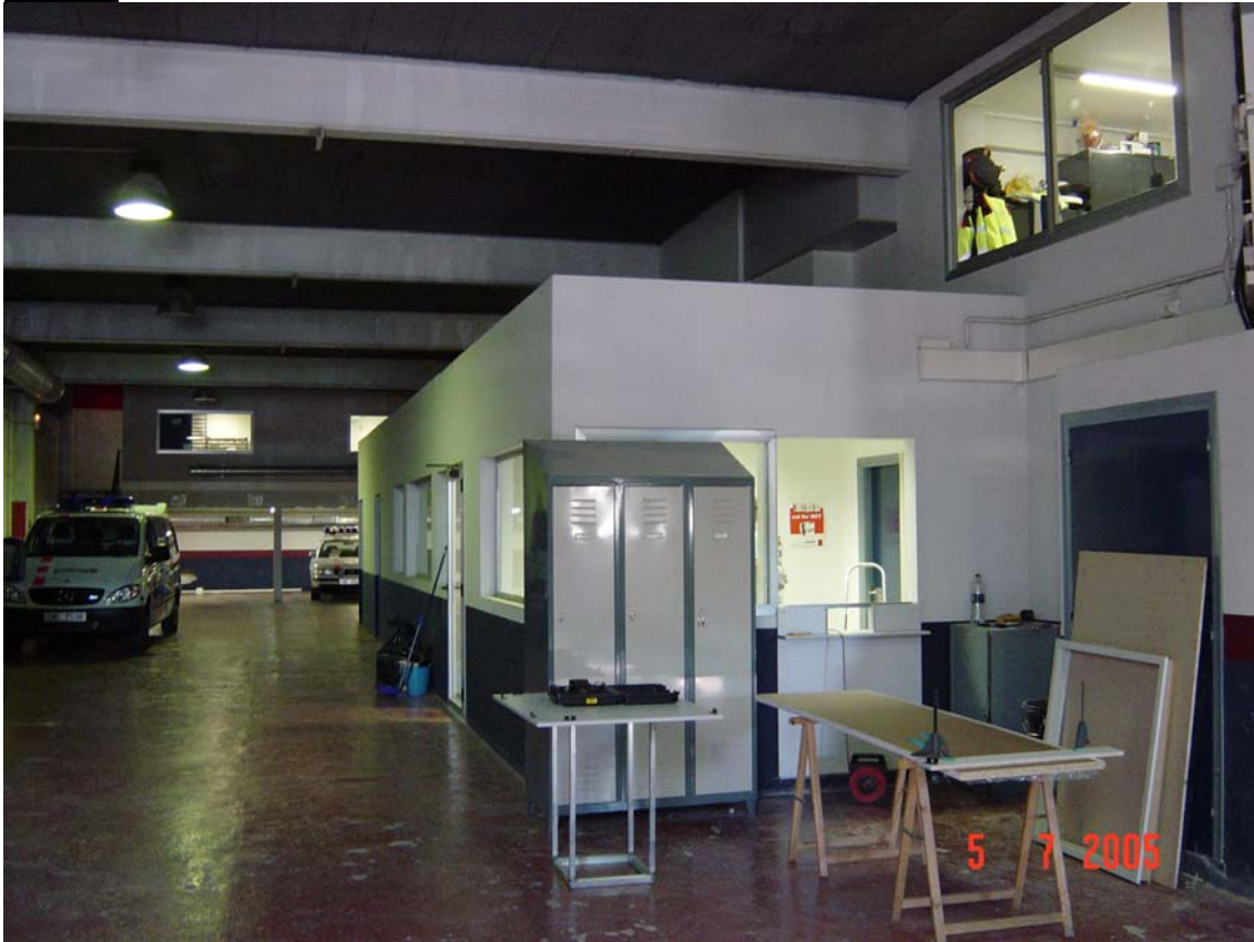
Dependències amb barreres arquitectòniques, sense ventilació exterior ni llum natural