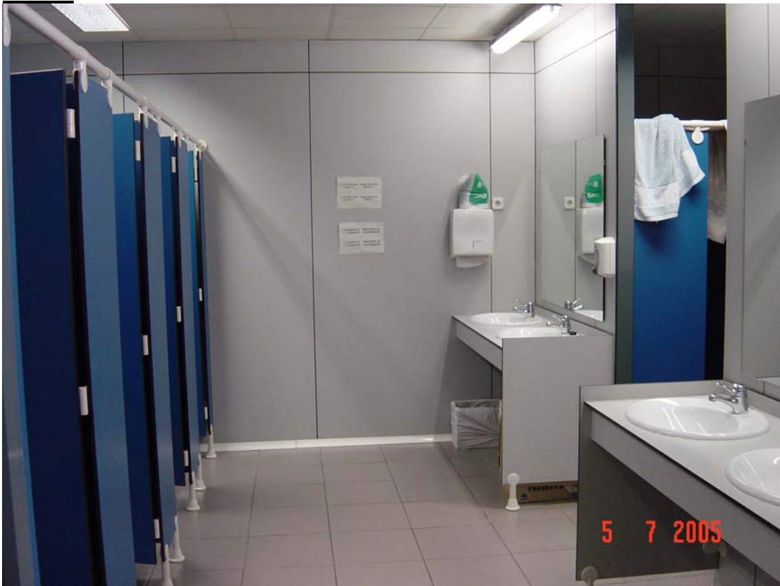
Lavabos i dutxes sense ventilació