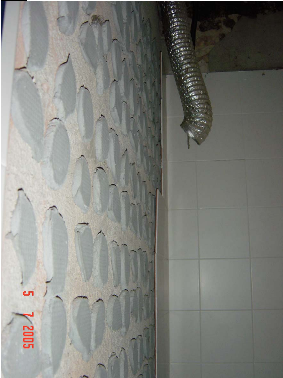
Estat de la paret del mateix lavabo