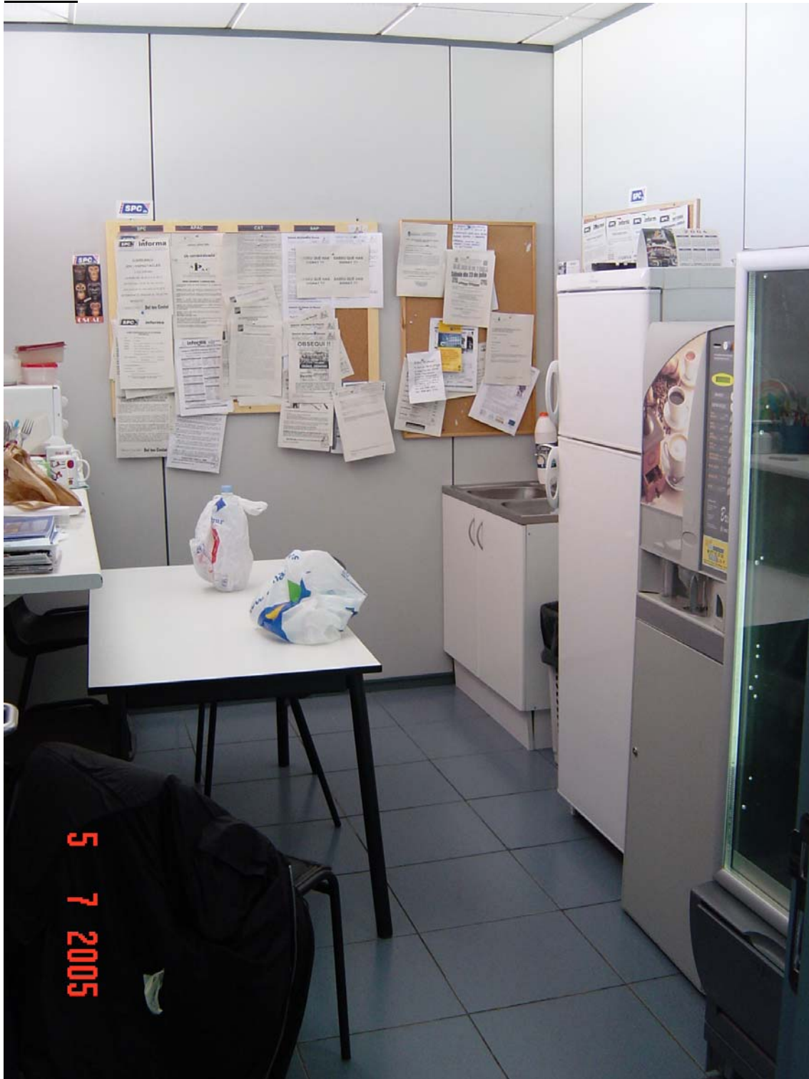
Menjador petit i sense cap tipus de ventilació a l'exterior