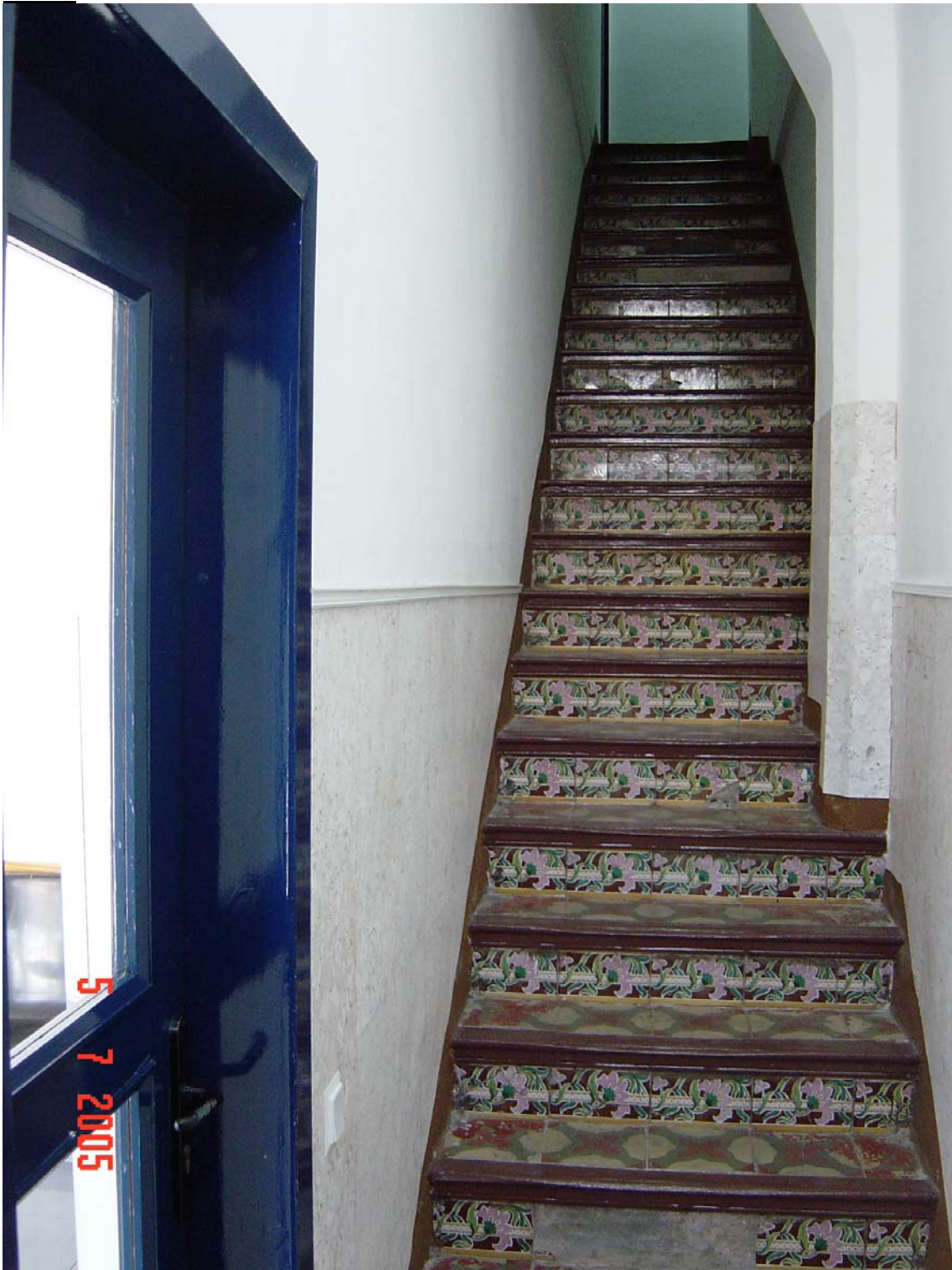
Dependència compartida amb vivenda particular