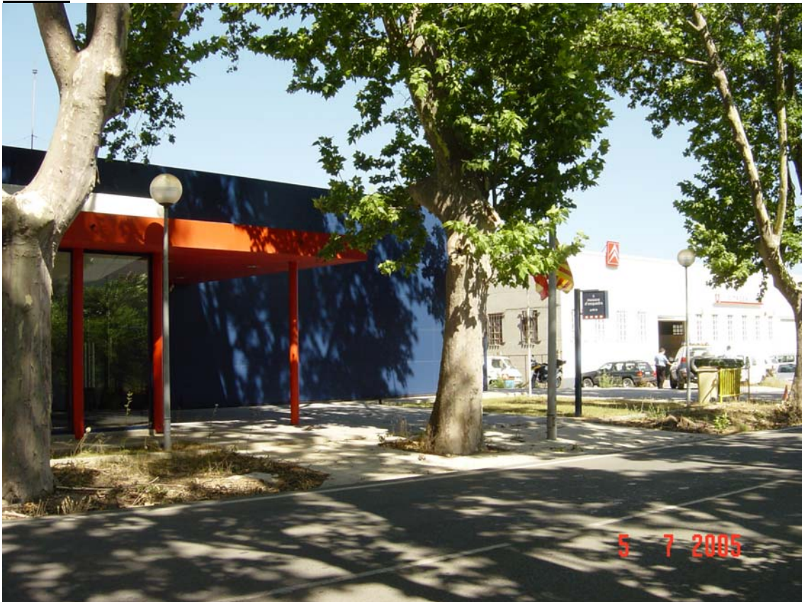
Manca de xarxa perimetral