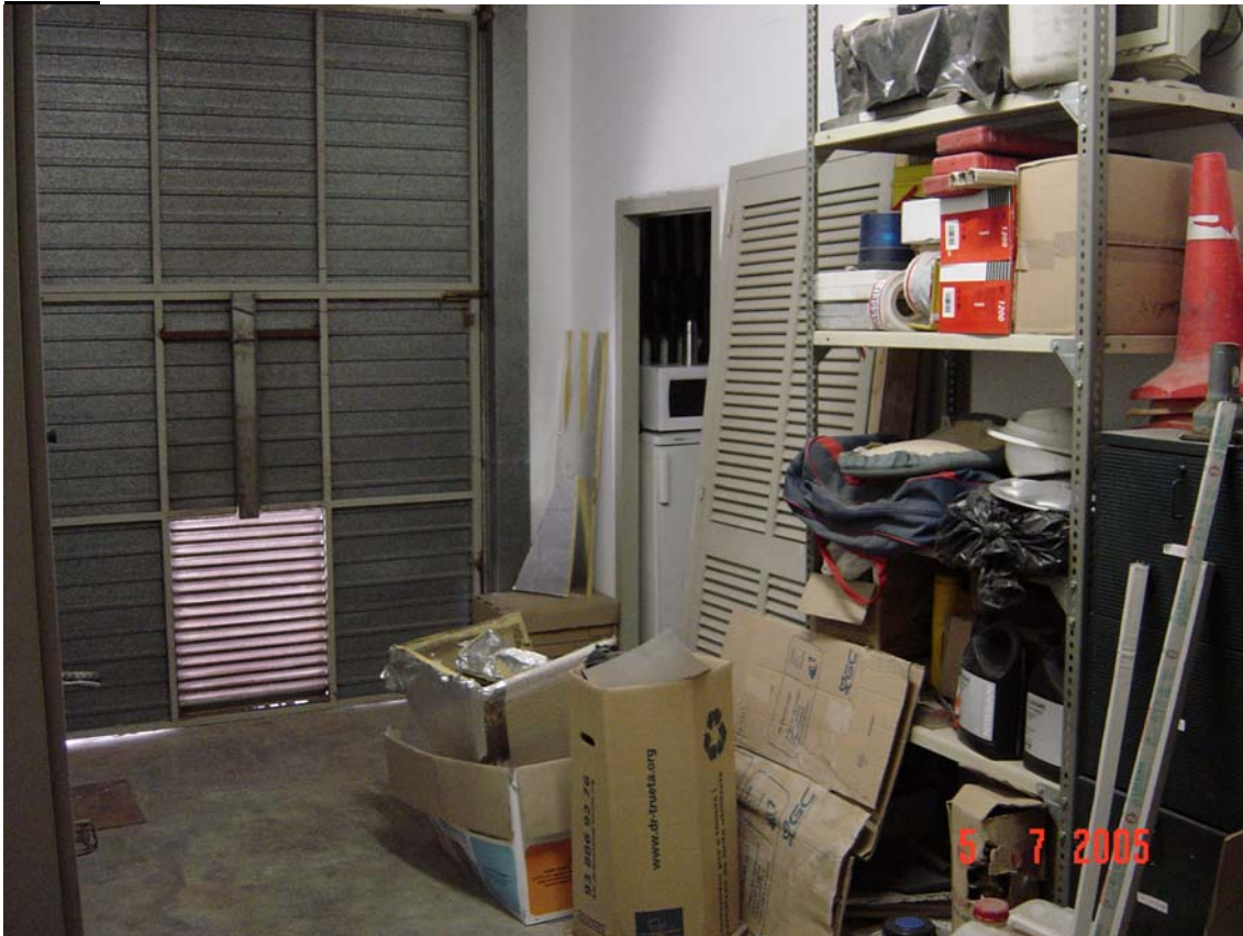
Situació inadequada del microones i la nevera