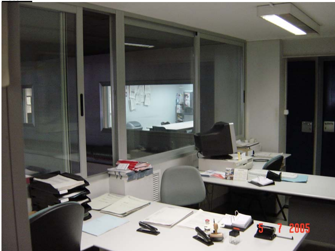
Dependències sense llum natural ni ventilació a l'exterior