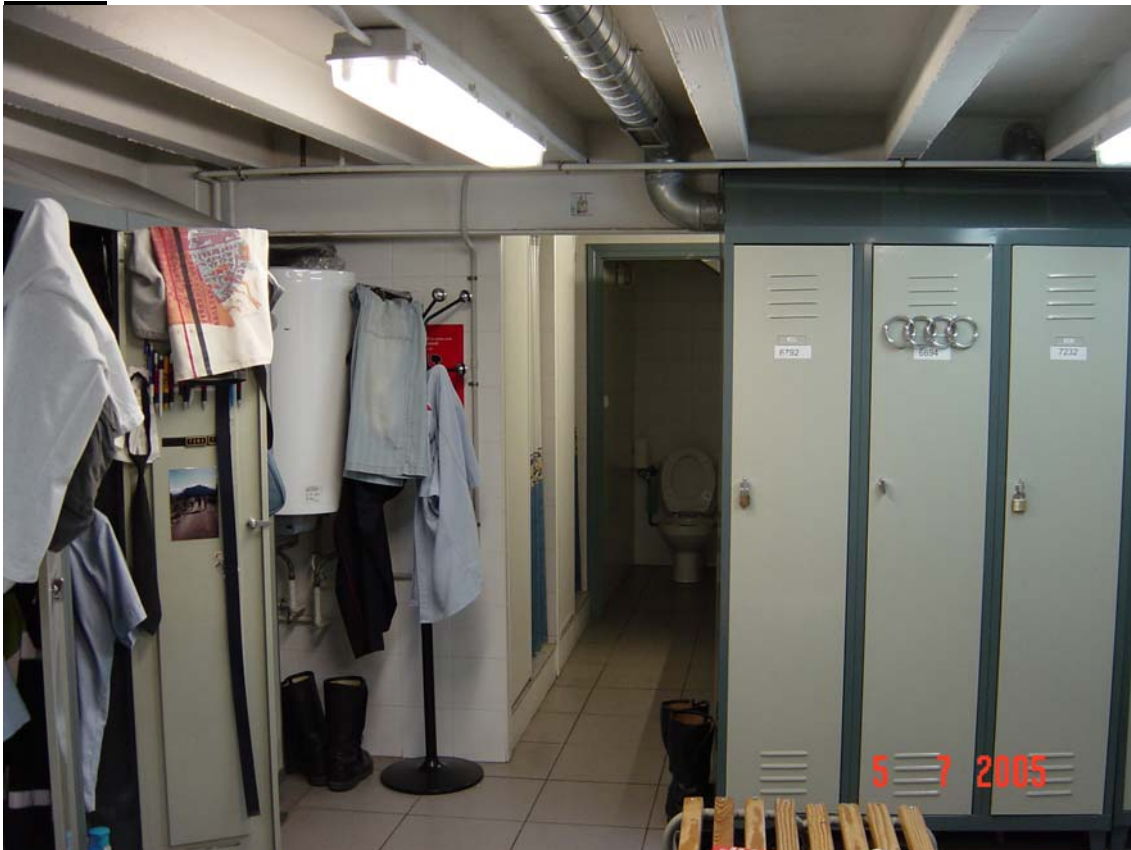
Vestidors petits i sense ventilació