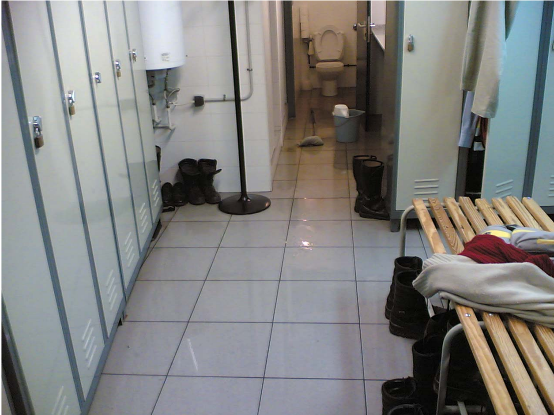
Vestuari d'homes (Trànsit).