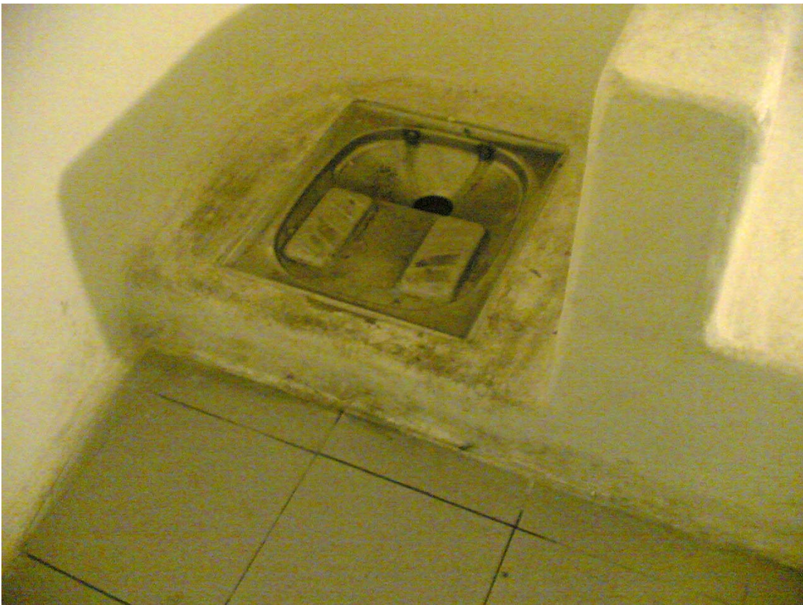
Letrina de la garjola de la Comissaria.