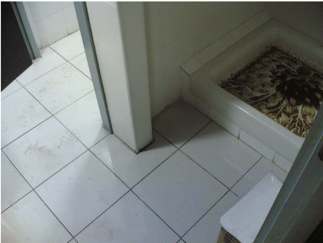
Lavabo del vestuari d'homes (Seguretat Ciutadana).