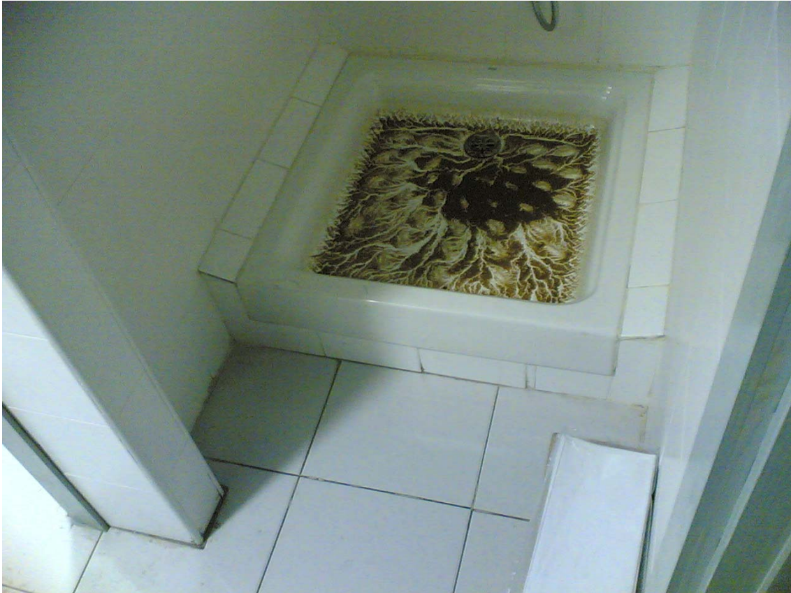
Dutxa del vestuari d'homes (Seguretat Ciutadana).