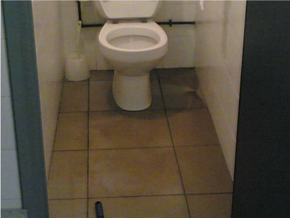
Lavabo del vestuari d'homes (Trànsit).